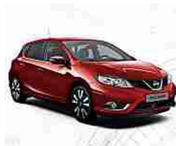
Nissan PULSAR. La tecnologia giusta, al momento giusto Nissan