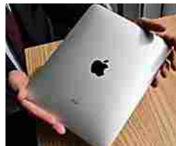
Stock di iPad rimasto in magazzino, valore 619€ in vendita per 40€ Swoggi