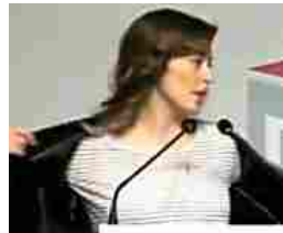
Boschi: 'Non sono rimasta nuda, ho solo tolto la giacca'