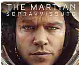
I film degli Oscar 2016 su Infinity: prova gratis 1 mese infinitytv.it