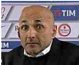
Spalletti: "Mio figlio mi ha detto: 'babbo che fai litighi con Totti?'"