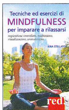
Kira Stellato Mindfulness per imparare a rilassarsi Red Edizioni Pagine 126 euro 10,00