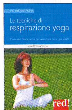
Maurizio Morelli Le tecniche di respirazione Yoga Red Edizioni Pagine 173 euro 10,00